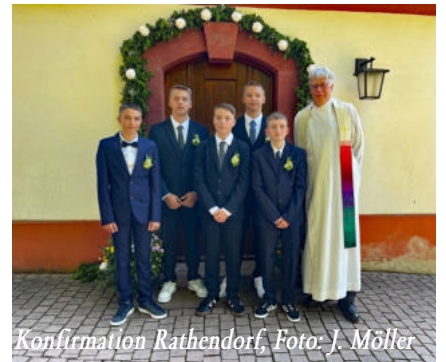
Konfirmation Rathendorf, Foto: J. Möller