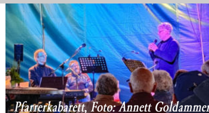
Pfarrerkabarett, Foto: Annett Goldammer

Zum Abschluss gab's ein gebührendes Geburtstagskaffee trinken mit sommerlichem Musikprogramm.