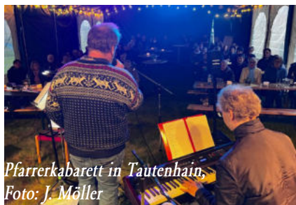
Pfarrerkabarett in Tautenhain