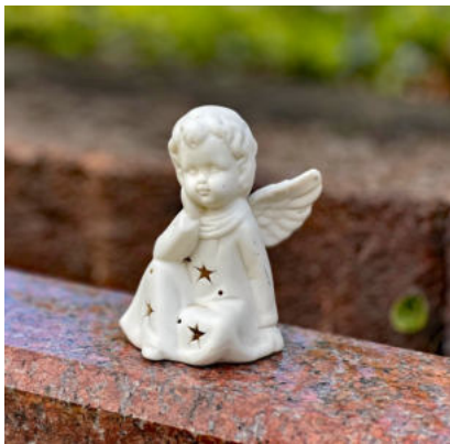
Engelsfigur Friedhof Niedersteinbach, Foto: Johannes Möller