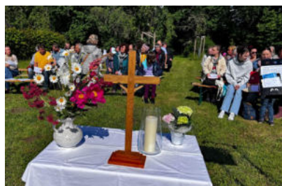
Gottesdienst am Himmelfahrtstag in Niedergräfenhain, Foto: Johannes Möller