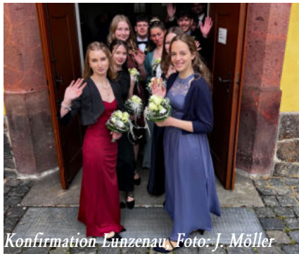
Konfirmation Lunzenau