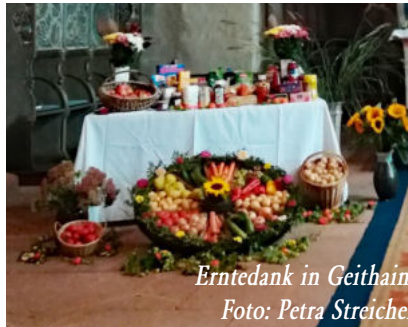
Erntedank in Geithain