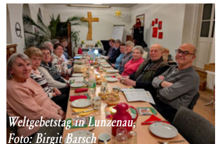
Weltgebetstag in Lunzenau, Foto: Birgit Barsch