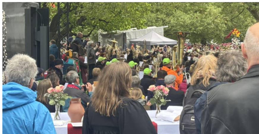
Besuch des Kirchentages 2025 mit Konfirmanden unserer Gemeinden, Foto: Maximilian Sossai