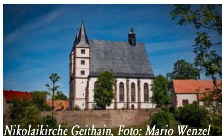
Nikolaikirche Geithain