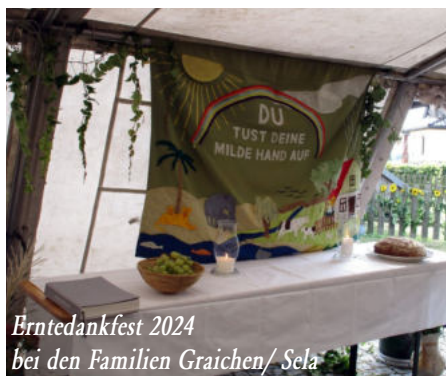
Erntedankfest 2024 bei den Familien Graichen/Sela