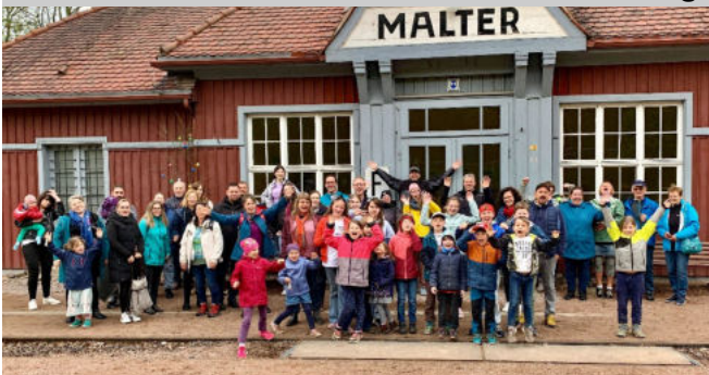
Familienfreizeit in Schmiedeberg

77 Interessierte waren wieder zu unserer Familienfreizeit angereist. Thematisch betrachteten wir die Jahreslosung: »Prüft alles, das Gute aber behaltet« (1. Thess. 5, 21). Es gab wirklich viel Gutes: Ein neues Jahreslosungslied, viele, die mit musiziert haben, interessante Bibelarbeiten, leckeres Essen und tolle Hauseltern, moderne Zimmer, einen eigenen Spiel- und Bolzplatz am Haus, Sonnenschein, wunderschöne Ausflüge und Zeit für Austausch miteinander, ein Überraschungs-Kuchenbuffet anlässlich meines runden Geburtstages, liebe Tagesgäste und Geschenke. Ganz herzlich danke ich allen, die diesen besonderen Tag für mich besonders gestaltet und mit mir gefeiert haben. Das war »spitze! Vorschau: nächste Familienfreizeit: 9. bis 12. April 2026 im Haus »Reudnitz« in Mohlsdorf-Teichwolframsdorf (70 Plätze) Franziska Möller