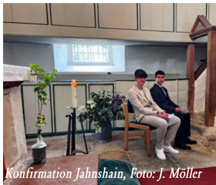
Konfirmation Jahnshain, Foto: J. Möller