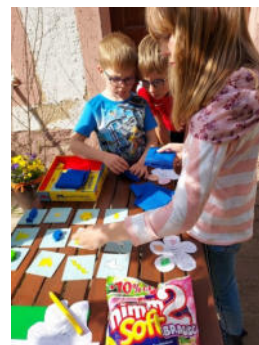
Kinderkirchen-Tag in Greifenhain und Benndorf