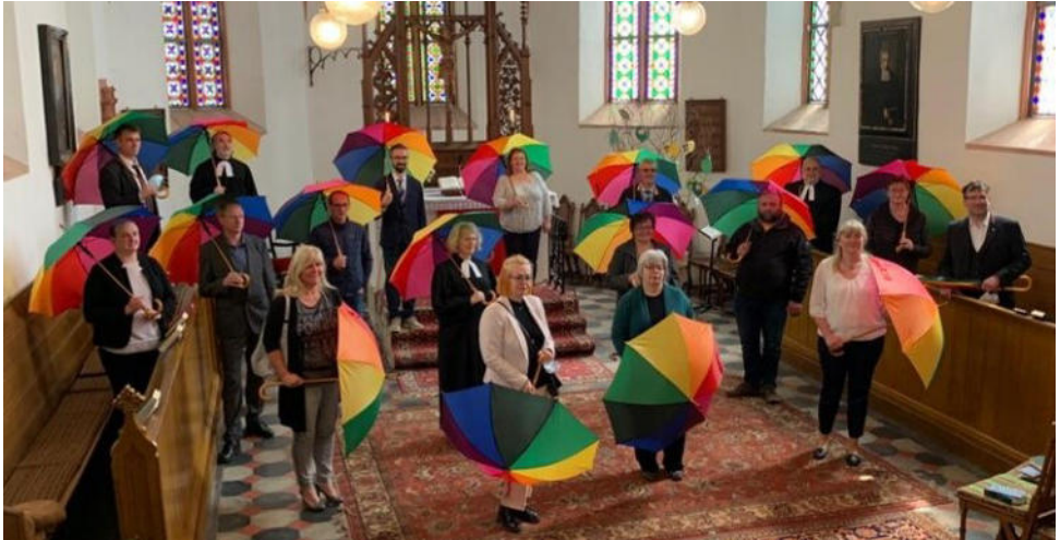
Einführungs-GD des neuen Kirchenvorstandes

An Sie alle gehen hiermit ein paar Bitten: Beten Sie für diese Arbeit! Informieren Sie ihre Kirchgemeindevertreter und Kirchenvorsteher aus Ihrer Gemeinde und informieren sie sich - auch über die Gemeinde hinaus. Machen Sie sich auch mit auf die Entdeckungsreise - gerade die Sommerkirche ist ein guter Anfangspunkt dafür.