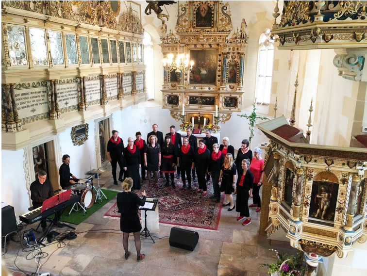
Gospelkonzert mit „Little light of L.E.“ am 22. Mai in Prießnitz