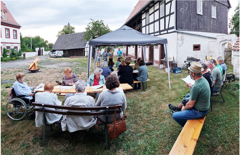
Johannisfeier am 24. Juni 2022 in Prießnitz