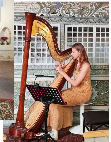
Konfirmation am 19. Juni 2022 in Nenkersdorf