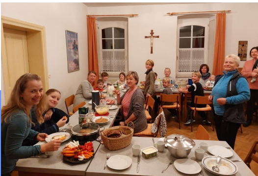
3. November 2022