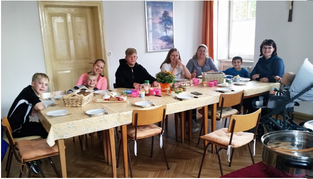
23. September 2022