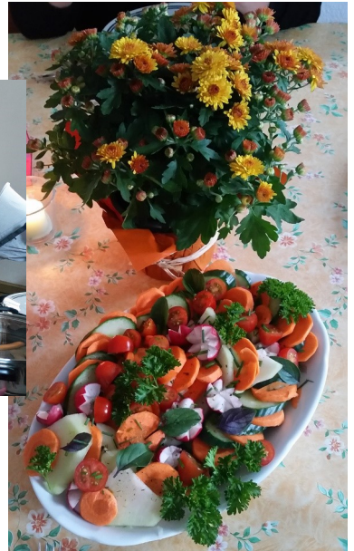
Familienabendbrot in Flößberg