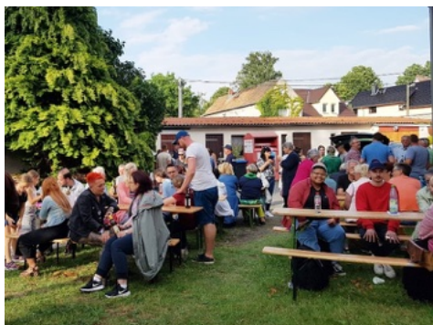
Kinderfest an der Kirche am 02.07.2023 in Nenkersdorf