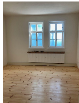
Impressionen der neu sanierte Pfarrwohnung in Frohburg