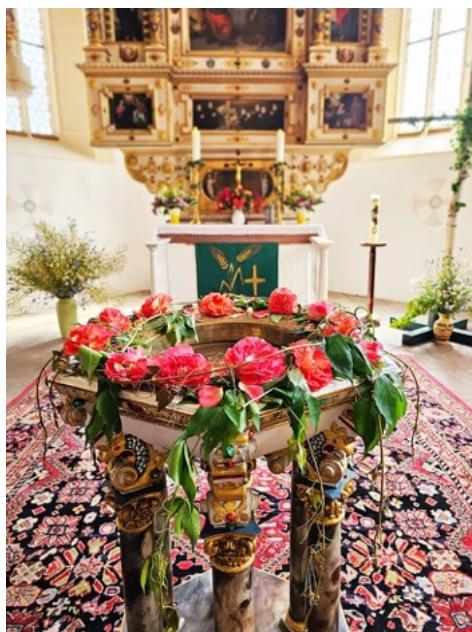
Taufgedächtnis mit Segnung am 25.06.2023 in Prießnitz