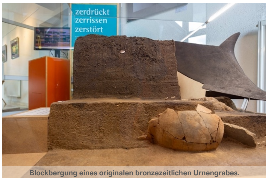
Blockbergung eines originalen bronzezeitlichen Urnengrabes.