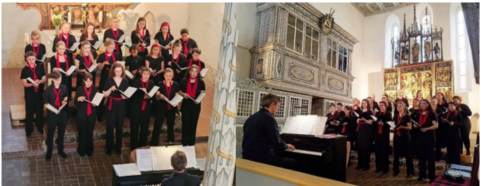
Benefiz-Konzert am 02.07.2023 in Nenkersdorf mit dem Gewandhauskinderchor Leipzig