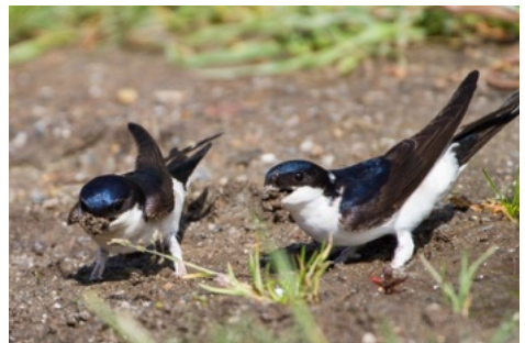
Mehlschnalben beim Sammeln von Nestmaterial.

Auch die Sächsische Landesstiftung Natur und Umwelt (LaNU) ist Partner beim Schwalbenschutz, sie finanziert die landesweite sächsische Mitmachaktion „Schwalben willkommen“.