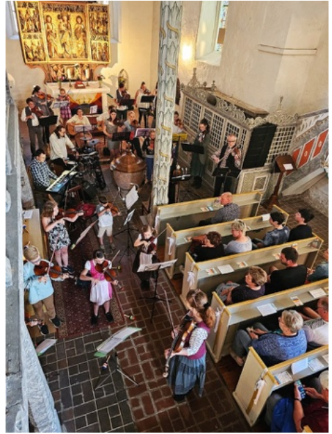
Benefiz-Konzert mit den „Dorffiedlern“